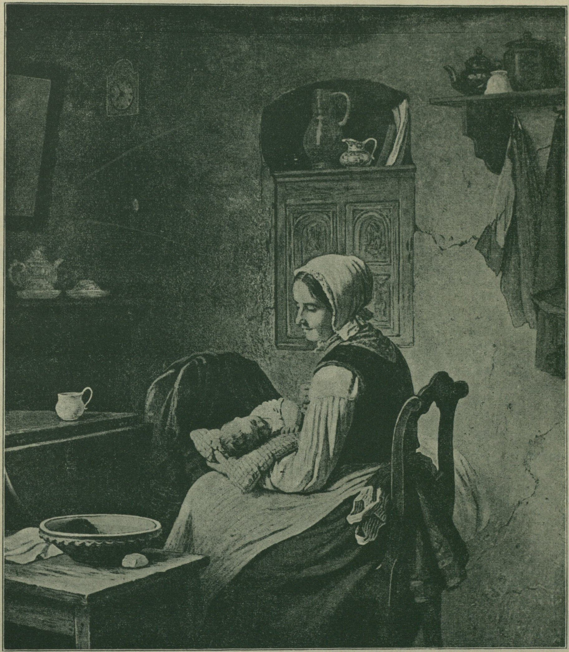
Meyer von Bremen