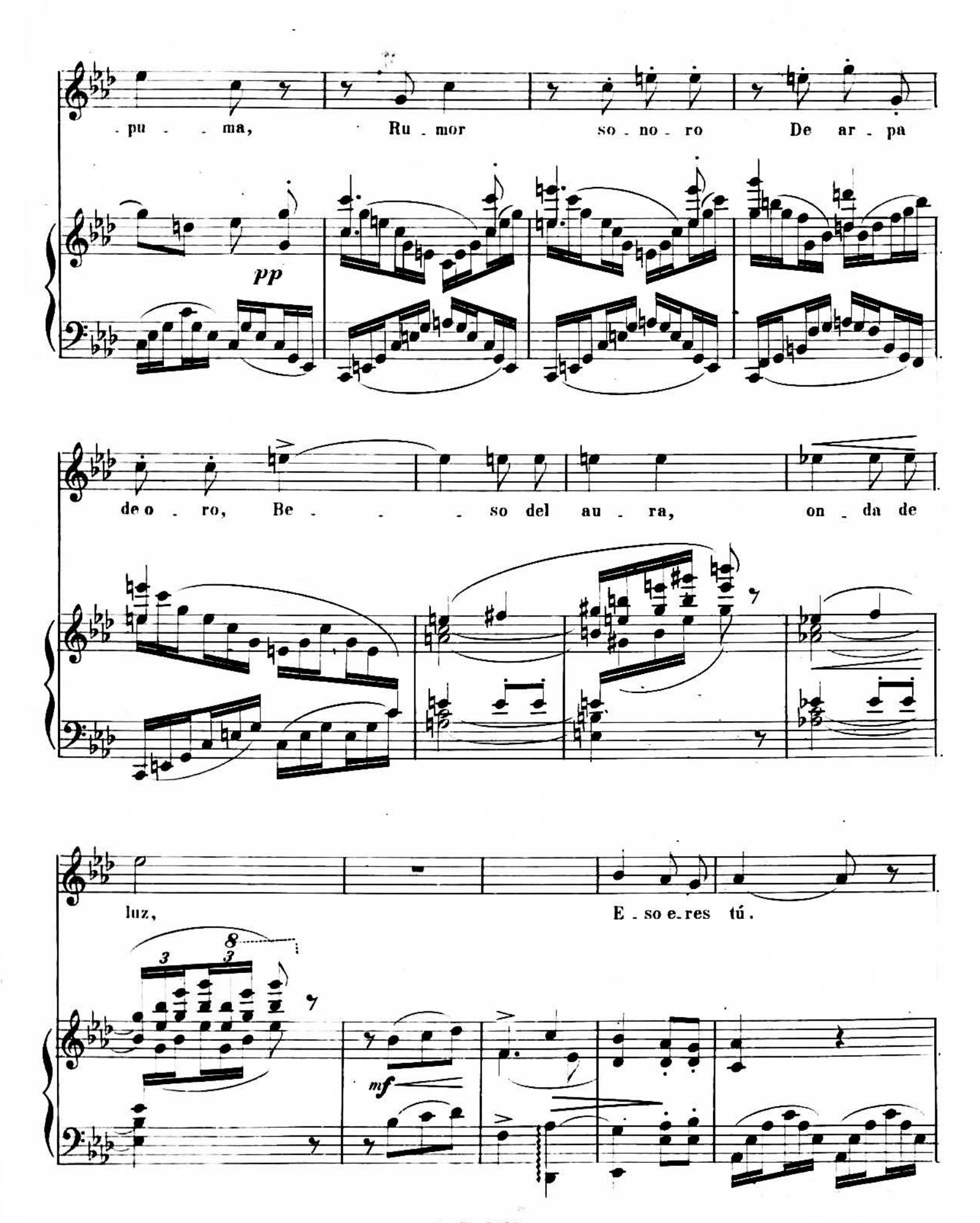
A. R. 7037.