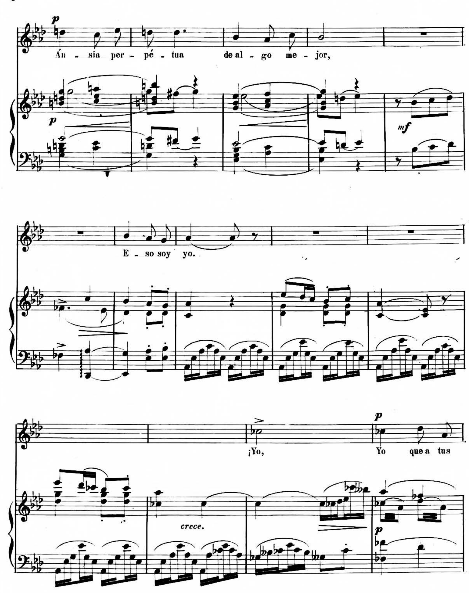
A. R. 7037.