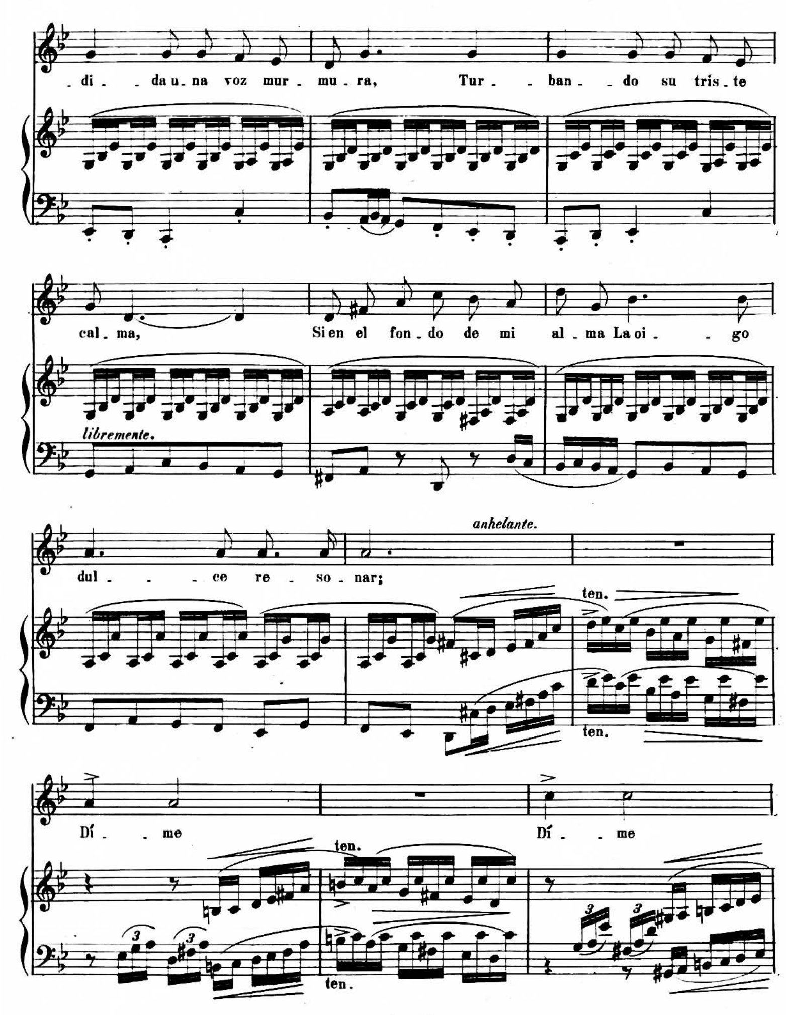
A. R. 7040.