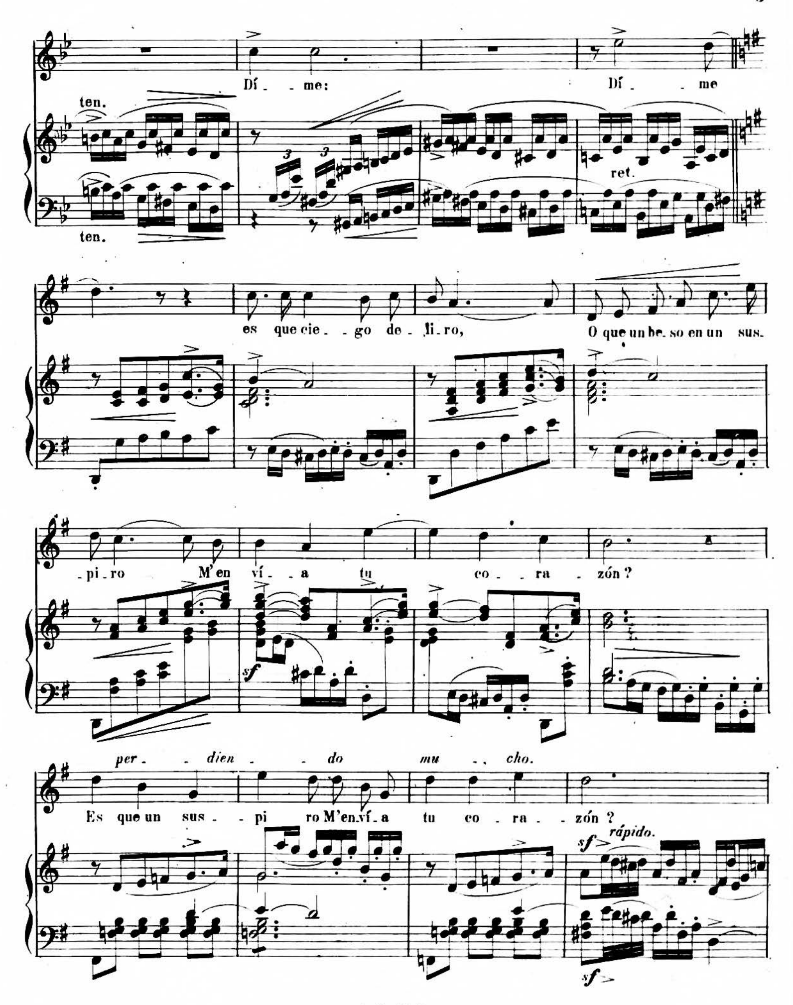
A. R. 7040. ~