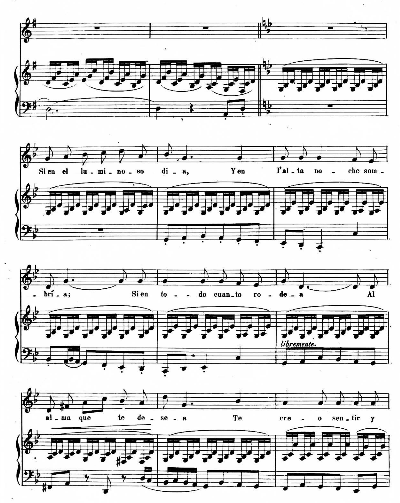
A. R 7040.