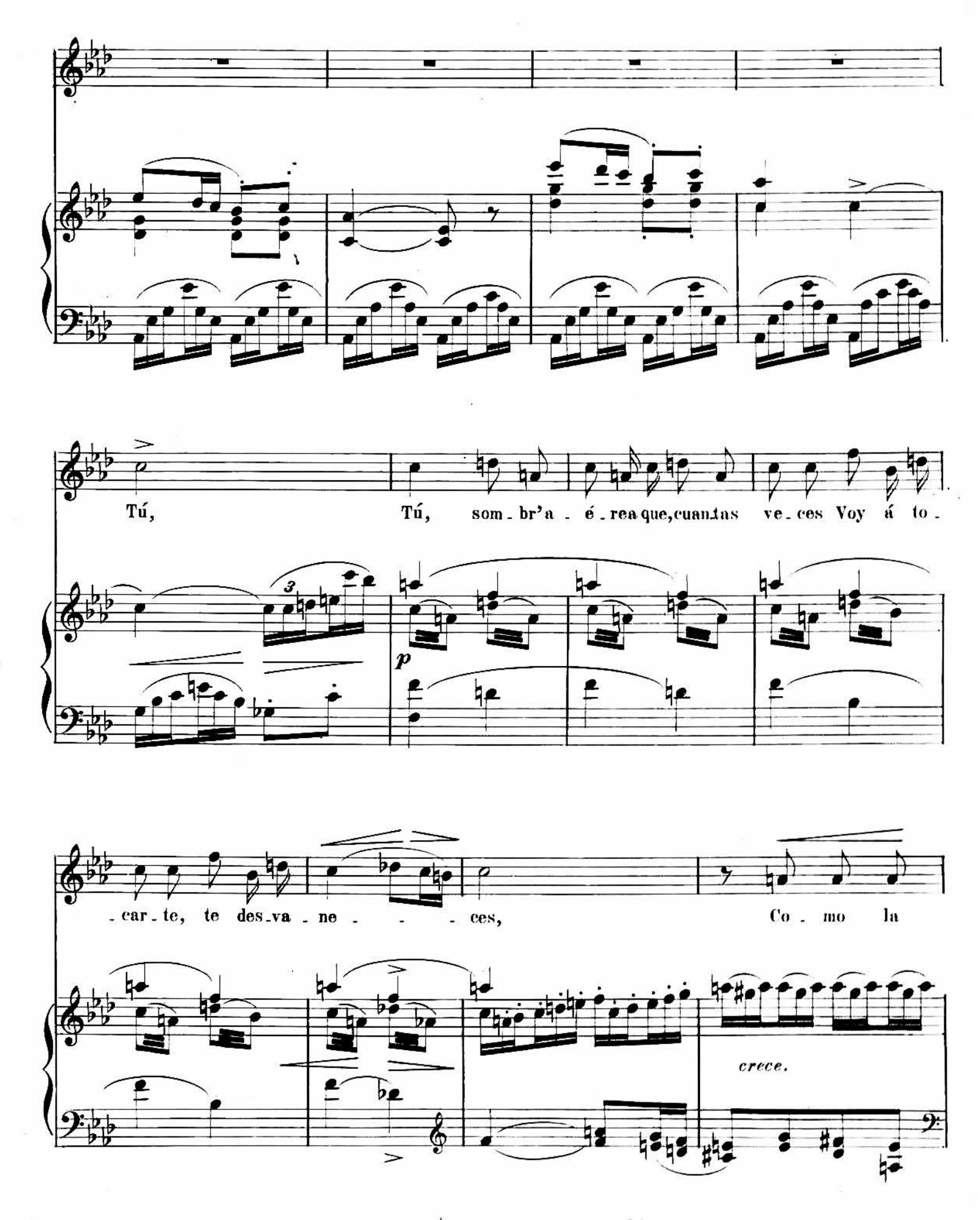
Å. R. 7037.