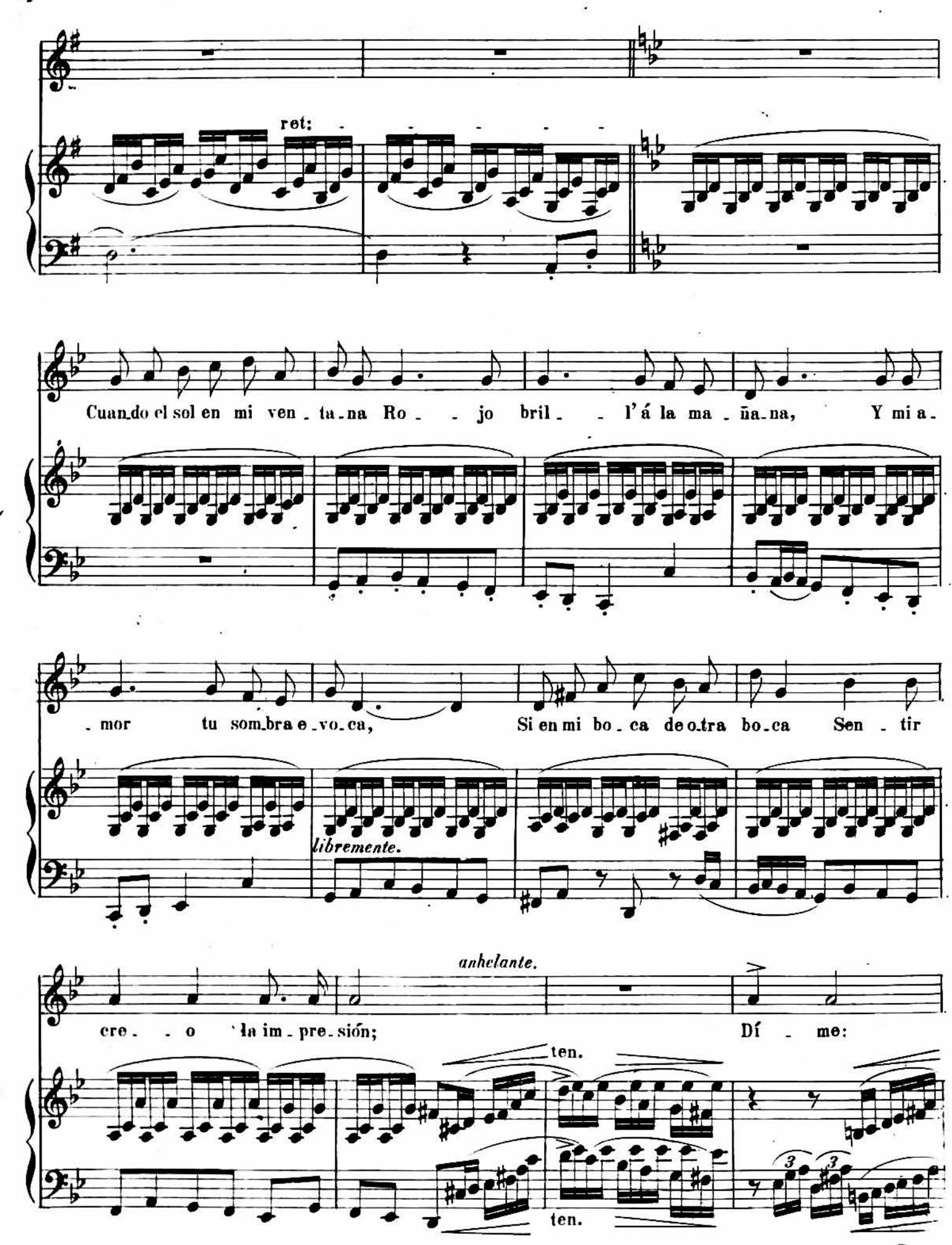
A R 7040