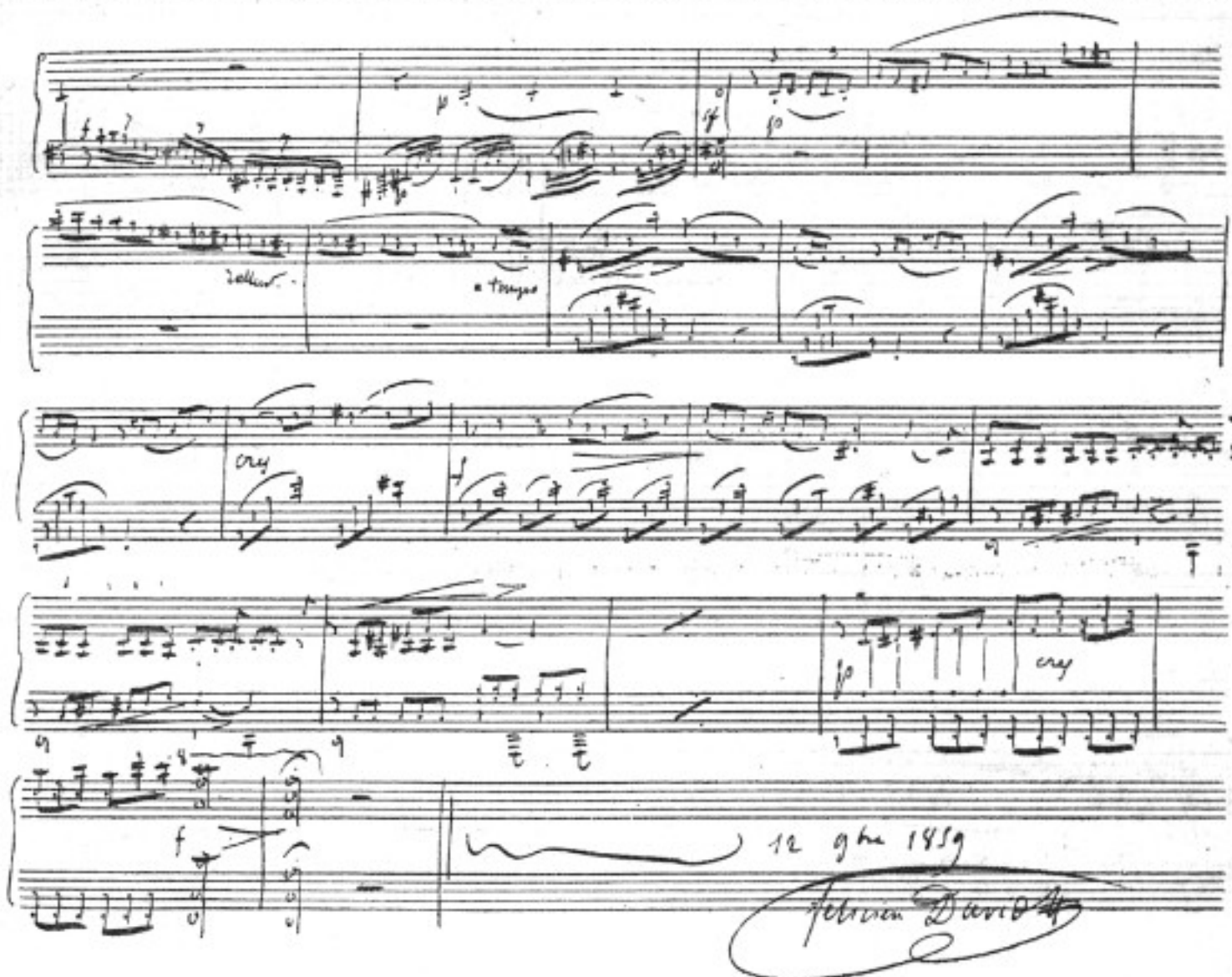
MANUSCRIT-AUTOGRAPHE DE FÉLICIEN DAVID.